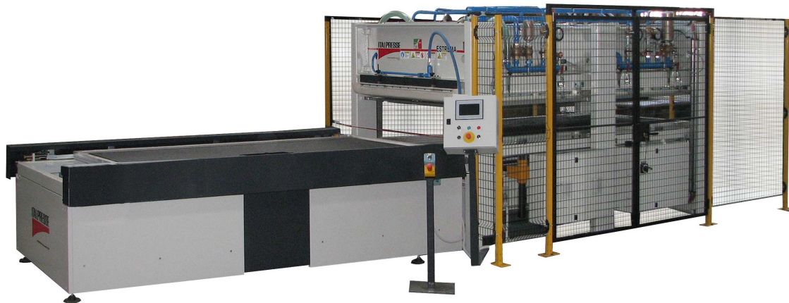
Информативная фотография оборудования без опции Наружная кабина